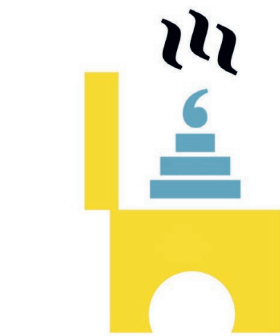
ILLUSTRATIE FADI NADROUS

Zo zijn de moderne luiers comfortabeler. Een kind vindt het wel gemakkelijk, want het voelt amper dat het nat is. Daarnaast steken ouders minder tijd en aandacht in zindelijkheidstraining, met als gevolg dat menig kind vlak voordat het naar school gaat nog een luier draagt. Vermandel: "Ouders lijken een angst te hebben ontwikkeld